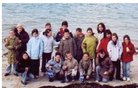
Les élèves de CM de l'école du Sacré Cœur en classe découverte