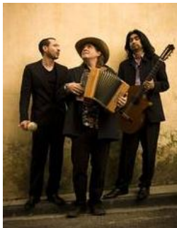
Le trio latino américain D'TINTO

Pensez à réserver au 0299436487 à partir du 15 septembre car le nombre de places est limité.