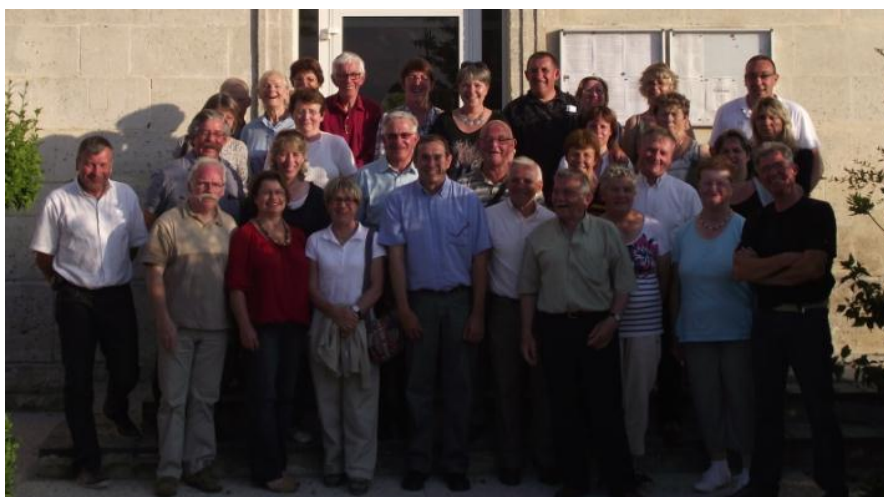
Les Briens 35 devant la mairie de Brie en Charente

La réunion des « Brie de France » 2013 aura lieu en Ariège.