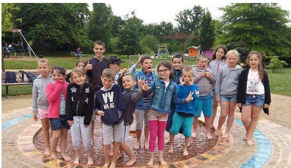
Sortie d'un groupe aux jardins de Brocéliande

Le local jeunes ouvert aux collégiens a permis de les accueillir tous les après-midi pour faire des activités tant manuelles que sportives, mais également des sorties à la journée, comme le rafting, le paintball ou une sortie à Saint-Malo.